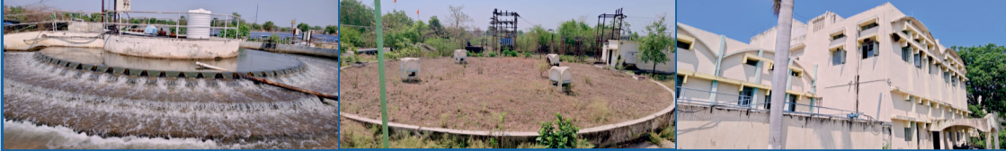
अकोला शहराला दररोज शुद्ध पाणी पुरवठा करणारे हेच ते प्रधान येथील जल शुद्धीकरण केंद्र. महान जल शुद्धीकरण केंद्र इमारत. महान जल शुद्धीकरण केंद्र इमारत.

महान अकोला मार्गावरील मुख्य जलकुंभ समोर रस्त्यावर वाहत असते पिण्याचे पाणी